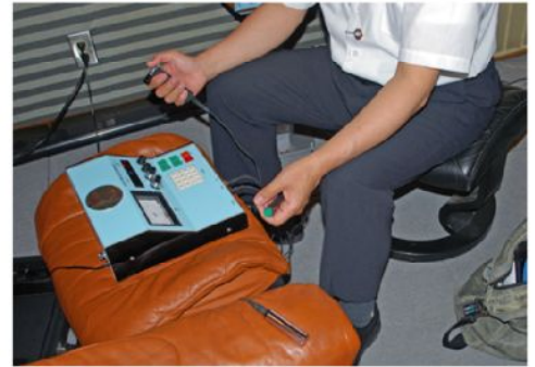
波動測定器にて測定、波動値にても数字でも効果が検証できています。

音波は（「波動」「物質波」「横波」）と考えられ、スピーカー開発している有名メーカーもあります。