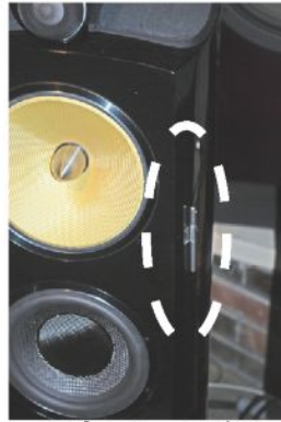
スピーカーに貼る