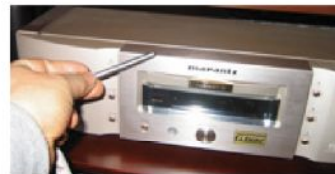
アンプ、CDプレーヤーのシャーシーに貼る