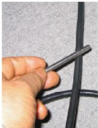
スピーカー、RCA、電源ケーブル、電源タップデジタルケーブルに貼る