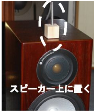
スピーカー上に置く