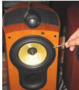
ツイーターに貼るウーハーに貼る