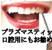
プラスマスティックA 口腔用にもお勧め

機器、スピーカーに触れるだけでも、エネルギーバランスが整い、スピーカーの存在感が消え、コンサートステージが目の前にあるような感覚で、音楽に没頭でき楽しめます。店頭でも実演試聴できますので、聴いて下さい。